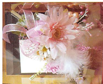
▲先生方をイメージして作っていただきました