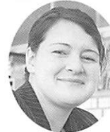
ALT ニコル・キューシク