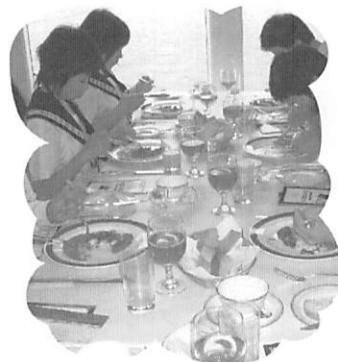
東京湾ベイクルージングでのテーブルマナー

三日間の修学旅行の中で、私がかつ心に残っているのは、二日目の東京班別研修です。前に計画は立てていたけれど、東京という初めて来た地で、計画どおりに研修できるか不安でした。最初は、どの切符を買うのか、どの電車に乗るのかも分からない状態だったけれど、班のみんなが協力して、計画どおりにまわってくることができました。修学旅行で身につけた団結力をこれからの学校生活でいかしていきたいと思っています。