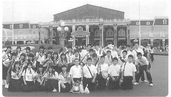
▲東京ディズニーランドにて

<6月25日> ホテル→横浜地区研修(班別)→新横浜駅→岐阜羽島駅→学校 10:30～14:00頃 15:53発 ひかり379号 17:34着