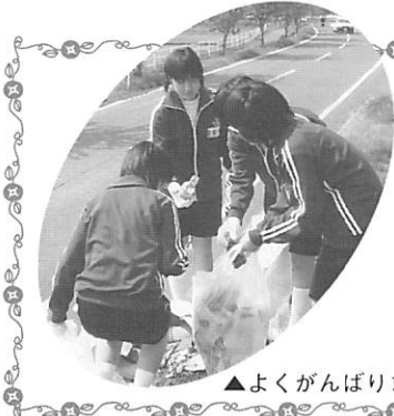
▲よくがんばりました