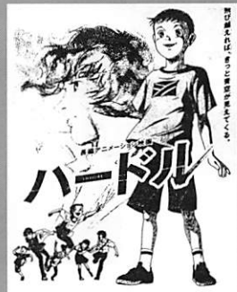
■主催/輪之内町PTA連合会