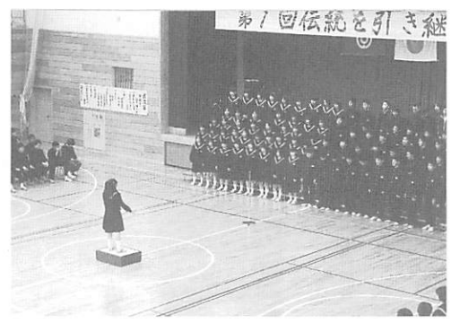
第1回伝統を引き継ぐ