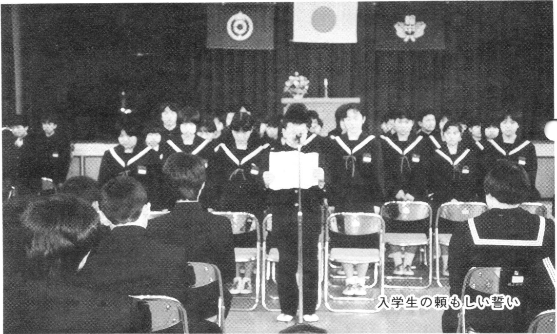
入学生の頼もしい誓い

編 集 発 行 安八郡輪之内中学校 PTA 会報委員会 題 字 前輪之内中学校長 江 木 洋 治 印 刷 (株)ダイキユー